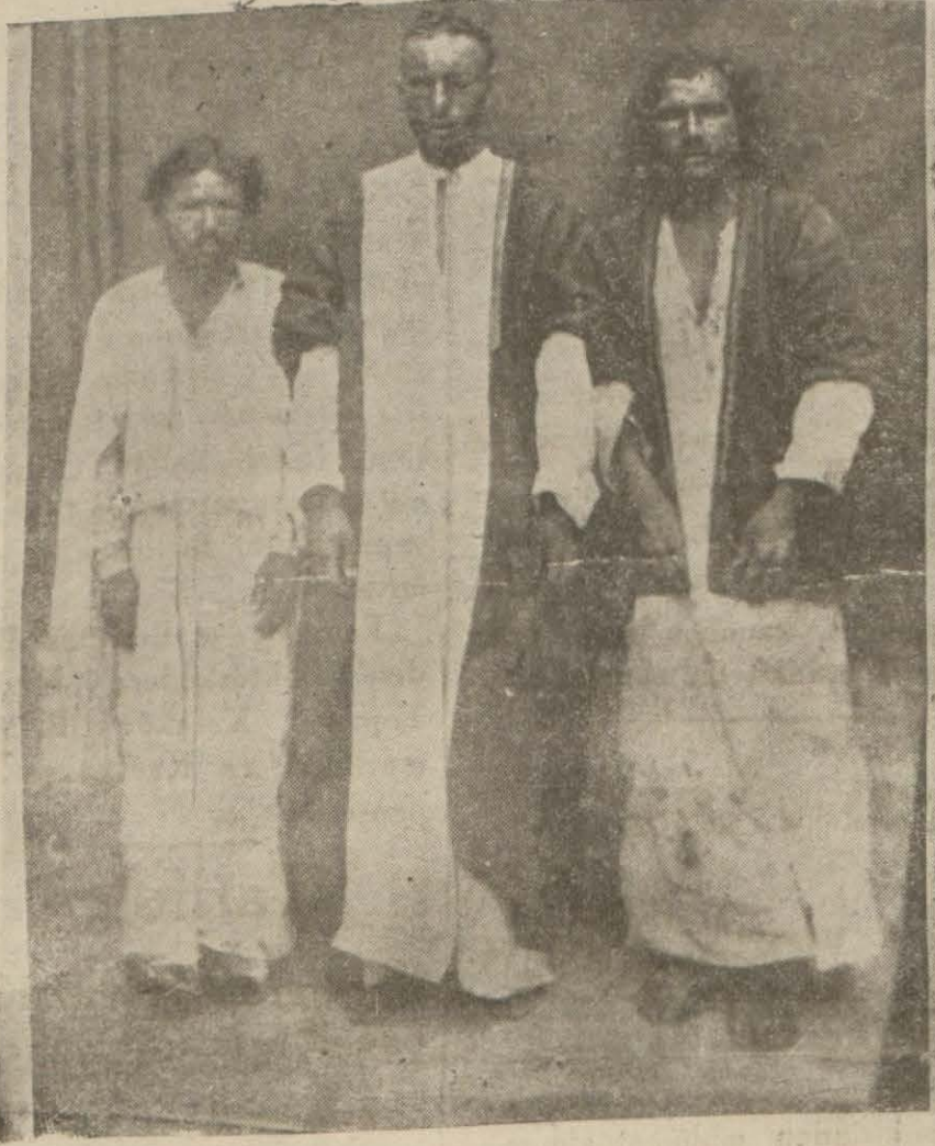
Yakalanan üç silâhli haydut

Haydutlar, Dağa Kaldırdıkları Bir Deveciyi De Öldürmüşlerdir